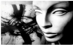
SALETTA TEMPO GIOVANE - via Europa • TORREGLIA • ORE 21 INGRESSO LIBERO

Il Gruppo Fotografico Tauriliarte con il patrocinio del Comune di Torreglia propone gli incontri di FOTOGRAFIA